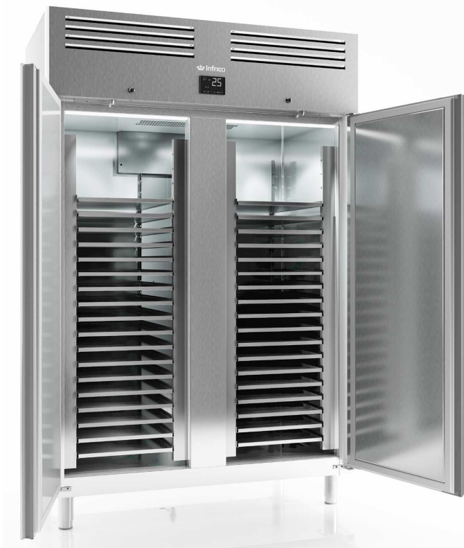
AGB 1402 PAST