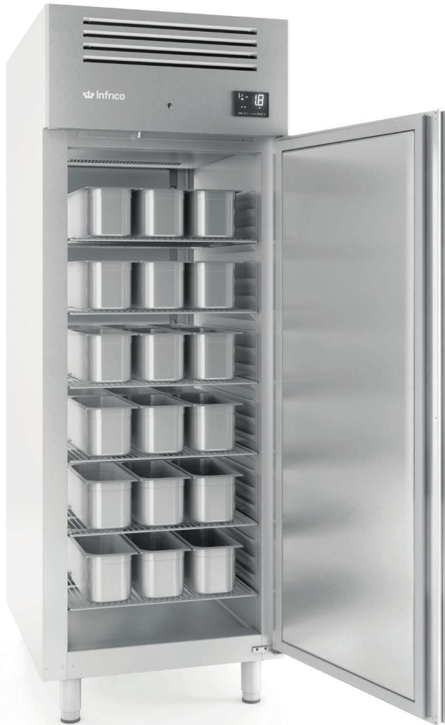
AGB 901 BT

Armario de Refrigeración y Congelación euronorma 800x600.