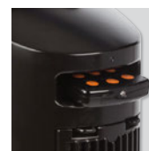
Compartimento para control remoto