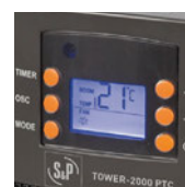
Pantalla LCD. Control electrónico