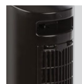
Asa para transporte. Filtro de aire lavable