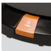
Interruptor ON/OFF de pie ergonómico