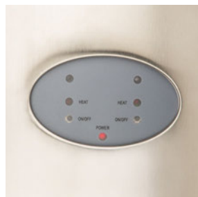
Panel de control