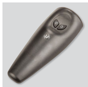
Mando a distancia