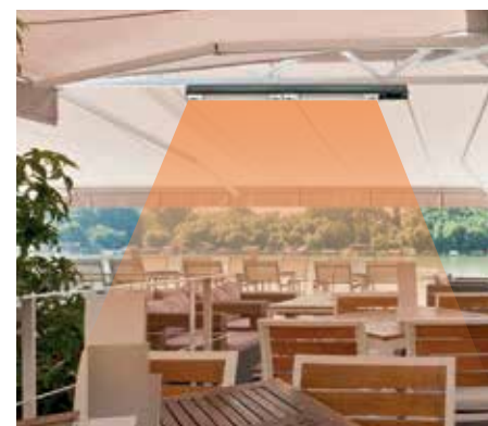
Instalación bajo toldo.