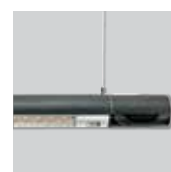
Instalable en techo y pared.