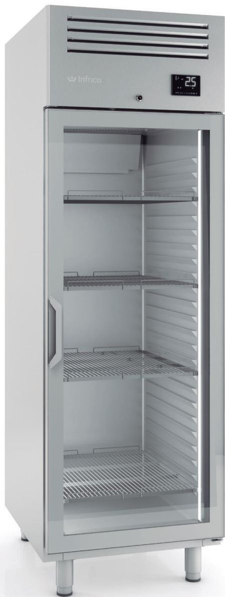
AGB 701 CR